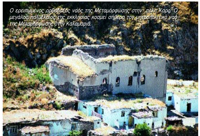
Ο ερειπώμενος ορθόδοξος ναός της Μεταμόρφωσης στην πόλη Καρς. Ο μεγάλος παλιέλαιος της εκκλησίας κοσμεί σήμερα τον μητροπολιτικό ναό της Μεταμόρφωσης στην Καλαμαριά.

Και όμως ! Μέσα σ' αυτόν τον ξένο κι αφιλόξενο τόπο, οι Έλληνες δημιούργησαν ξανά πατρίδες προσαρμοσμένες στις νέες σκληρές συνθήκες. 76 νέα Ποντιακά χωριά χτίστηκαν στην περιοχή του Κάρς. Ελεύθεροι να μιλούν τη γλώσσα και να τηρούν τα έθιμα και τις παραδόσεις τους, έχτιζαν νέα σχολεία και εκκλησίες. Δεκάδες χιλιάδες ελληνικές ψυχές έζησαν στο Καρς επί σαρά-