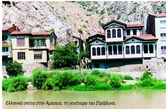
Ελληνικά σπίτια στην Αμάσεια, τη γενέτειρα του Στράβωνα.