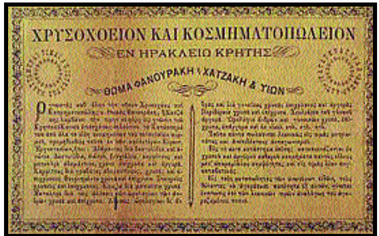
Ανακοίνωση του χρυσοχόου και κοσμηματοπώλη Θωμά Φανουράκη, στο φύλλο της 15ης Αυγούστου 1887 της κρητικής εφημερίδας Μίνως (Από το λεύκωμα του ΕΛΚΑ) και διαφήμιση στο φύλλο της 30ης Αυγούστου 1907 της εφημερίδας Ιδη (Από το λεύκωμα του ΕΛΚΑ).

Ο πωλητής άπλωνε στο πάτωμα τα κοσμήματα και οι ενδιαφερόμενοι μπορούσαν να διαλέξουν μία οκά από αυτά που τους άρεσαν, έναντι 400 δραχμών!