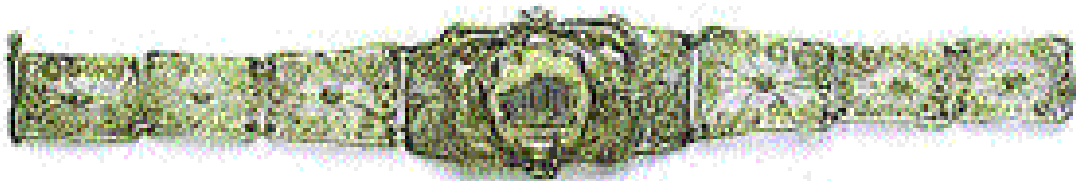
Ασημένιο βραχιόλι με αναπαράσταση της Ακρόπολης των Αθηνών στο κέντρο. Αργυρή καρφίτσα-αντίγραφο παραδοσιακών τσαρουχιών. Κοσμήματα αυτού του είδους πωλούνταν το 1940 κυρίως στους τουρίστες (από την οικογενειακή συλλογή του Αγαπητού Πουλκουρά)