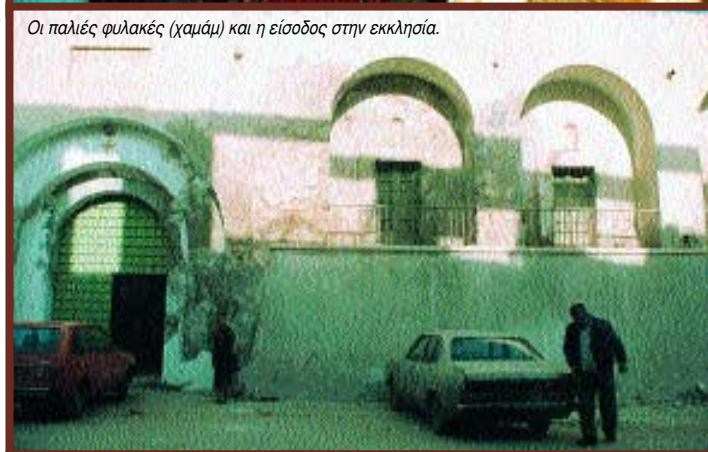
Οι παλιές φυλακές (χαμάμ) και η είσοδος στην εκκλησία.