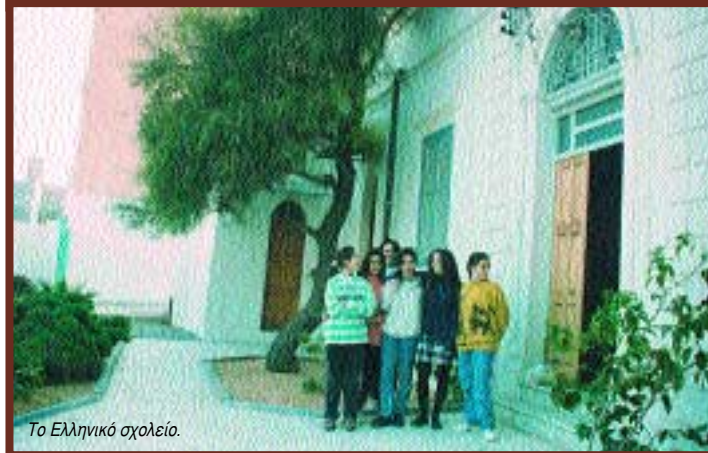
Το Ελληνικό σχολείο.